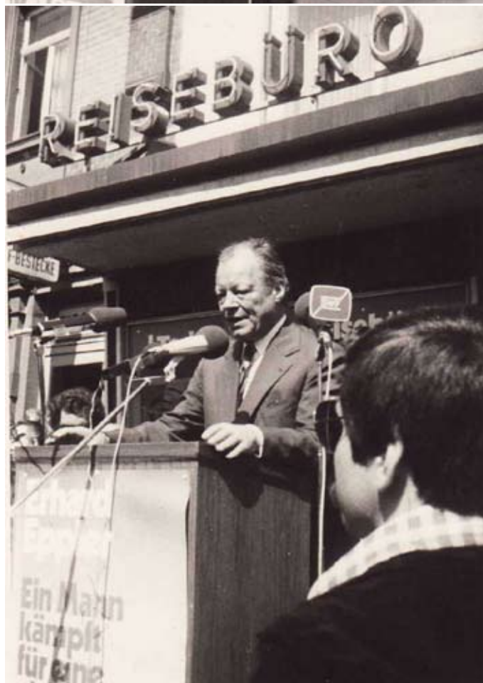
Willy Brandt bei einer Wahlveranstaltung am 01.04.1976 in Donaueschingen