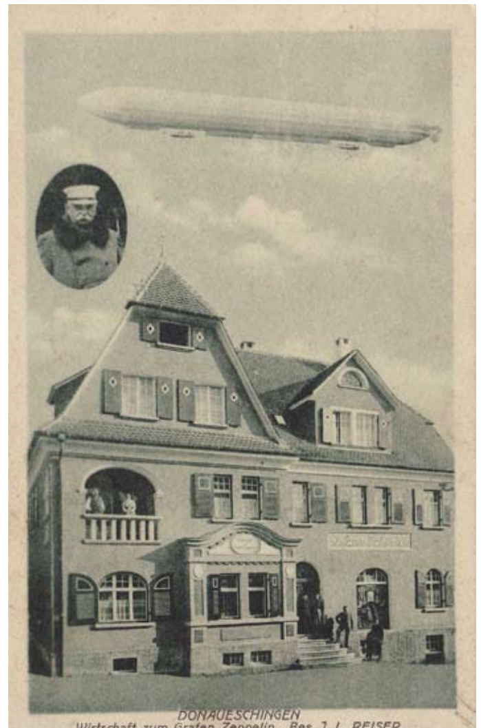
Gasthof Zeppelin: hier fanden in der Weimarer Zeit die meisten SPD-Veranstaltungen statt.

Die wichtigste Entscheidung des Gemeinderates war der Entschluss zum Bau eines neuen Krankenhauses in der Villinger Straße, das besonders vom Zentrum und von der SPD gefordert worden war. Am 12. Oktober 1921 war Grundsteinlegung. Die Urkunde im Grundstein trägt auch die Unterschriften der SPD-Gemeinderäte.